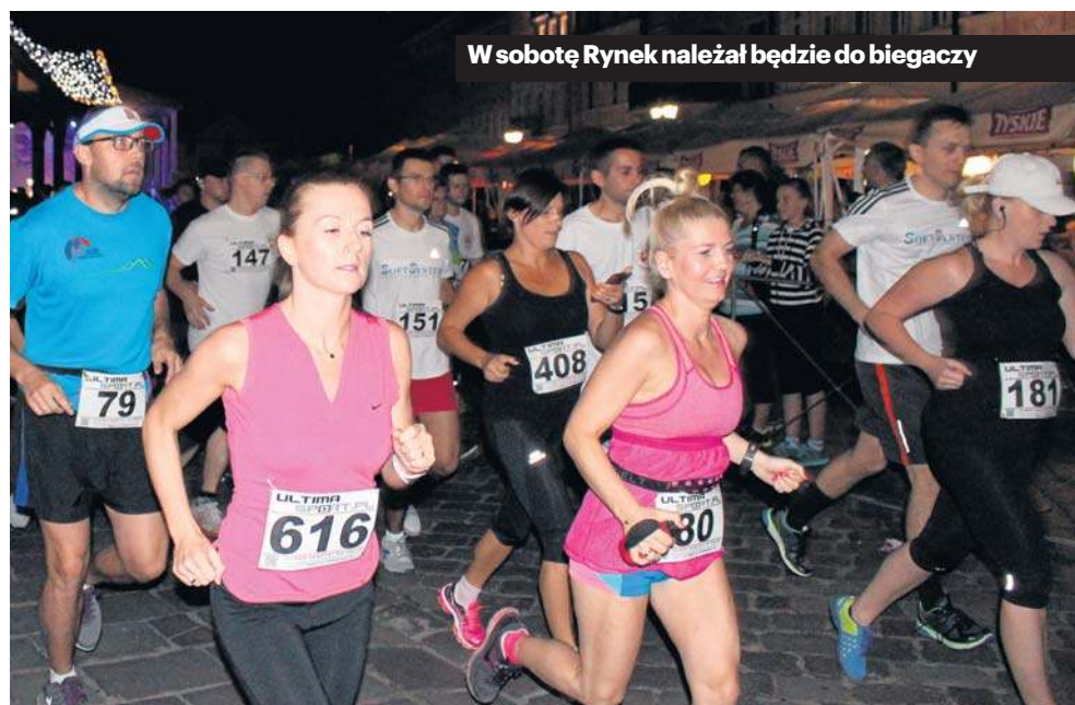
W sobotę Rynek należał będzie do biegaczy

O 16.30 rozpocznie się ceremonia rozdania nagród zwycięzcom wojewódzkiego konkursu li-