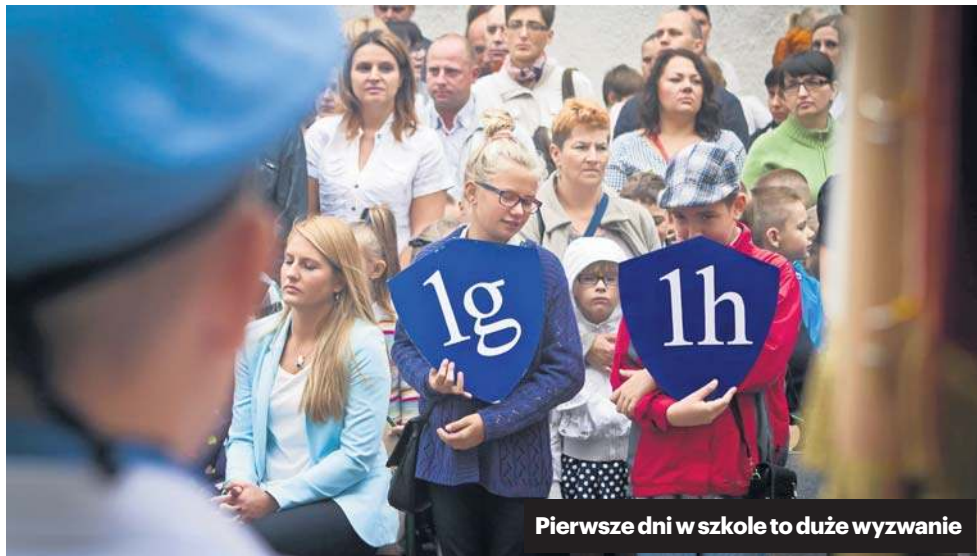
Pierwsze dni w szkole to duże wyzwanie

Pierwsze dni w szkole lub przedszkolu bywają bardzo trudne. Dziecku ciężko jest przyzwyczaić się do kilkugodzinnej rozłąki z rodzicami oraz sytuacji, w której opiekuje się nim ktoś inny niż mama lub tata. Aby oszczędzić maluchowi stresu, przygotowania do szkolnych i przedszkolnych realiów należy rozpocząć znacznie wcześniej.