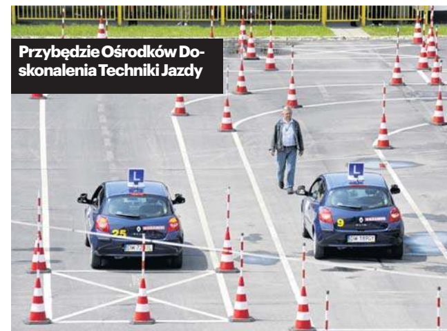
Przybędzie Ośrodków Doskonalenia Techniki Jazdy