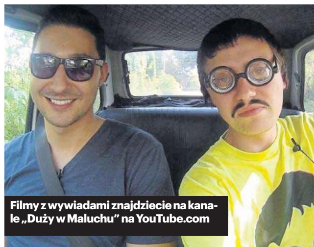
Filmy z wywiadami znajdziecie na kanale „Duży w Maluchu” na YouTube.com