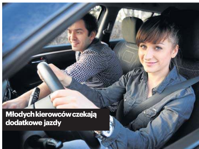
Młodych kierowców czekają dodatkowe jazdy