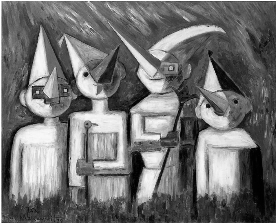
Tadeusz Makowski, Przebrane dzieci

Przyjrzyj się ilustracji i wykonaj zadania 20.–22.