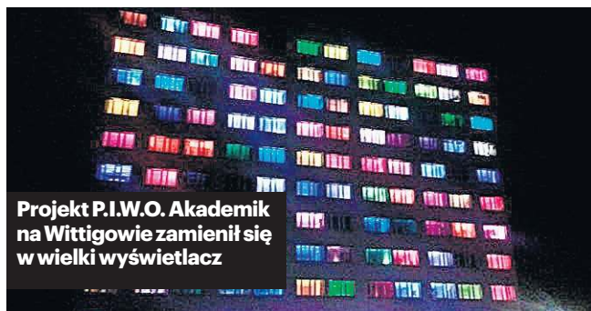
Projekt P.I.W.O. Akademik na Wittigowie zamienił się w wielki wyświetlacz