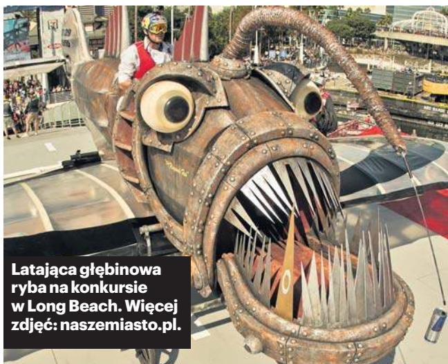
Latająca głębinowa ryba na konkursie w Long Beach. Więcej zdjęć: naszemiasto.pl .